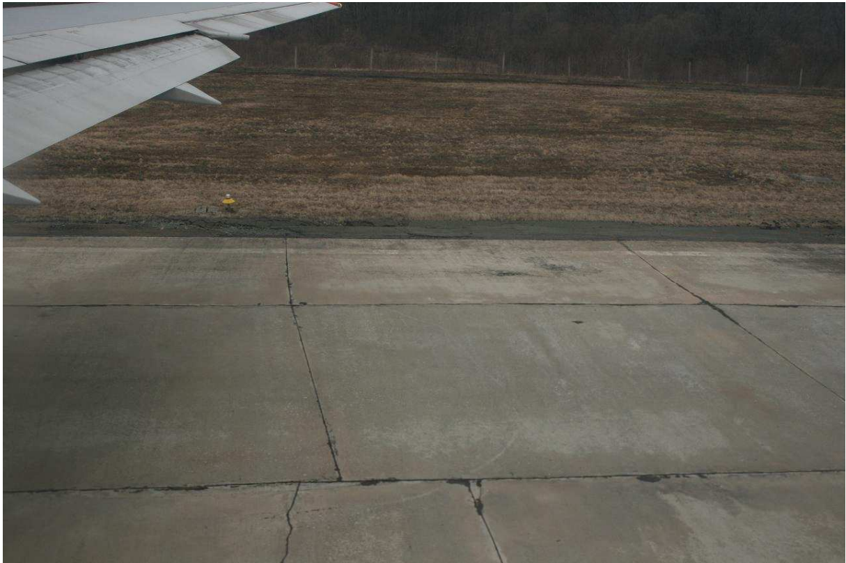
Betonbaan (start en landing) op vliegveld van Vladivostok

Om 15u45 (P.T.) landen op Moskou-Sheremetyevo, terminal-1.