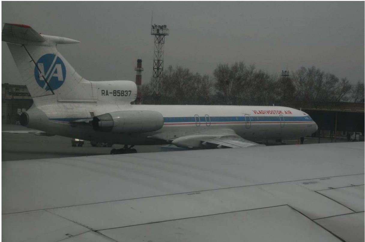
Tupolev van Vladivostok Air.....

We nemen afscheid, ik red mij verder wel, zoals gewoonlijk haha.