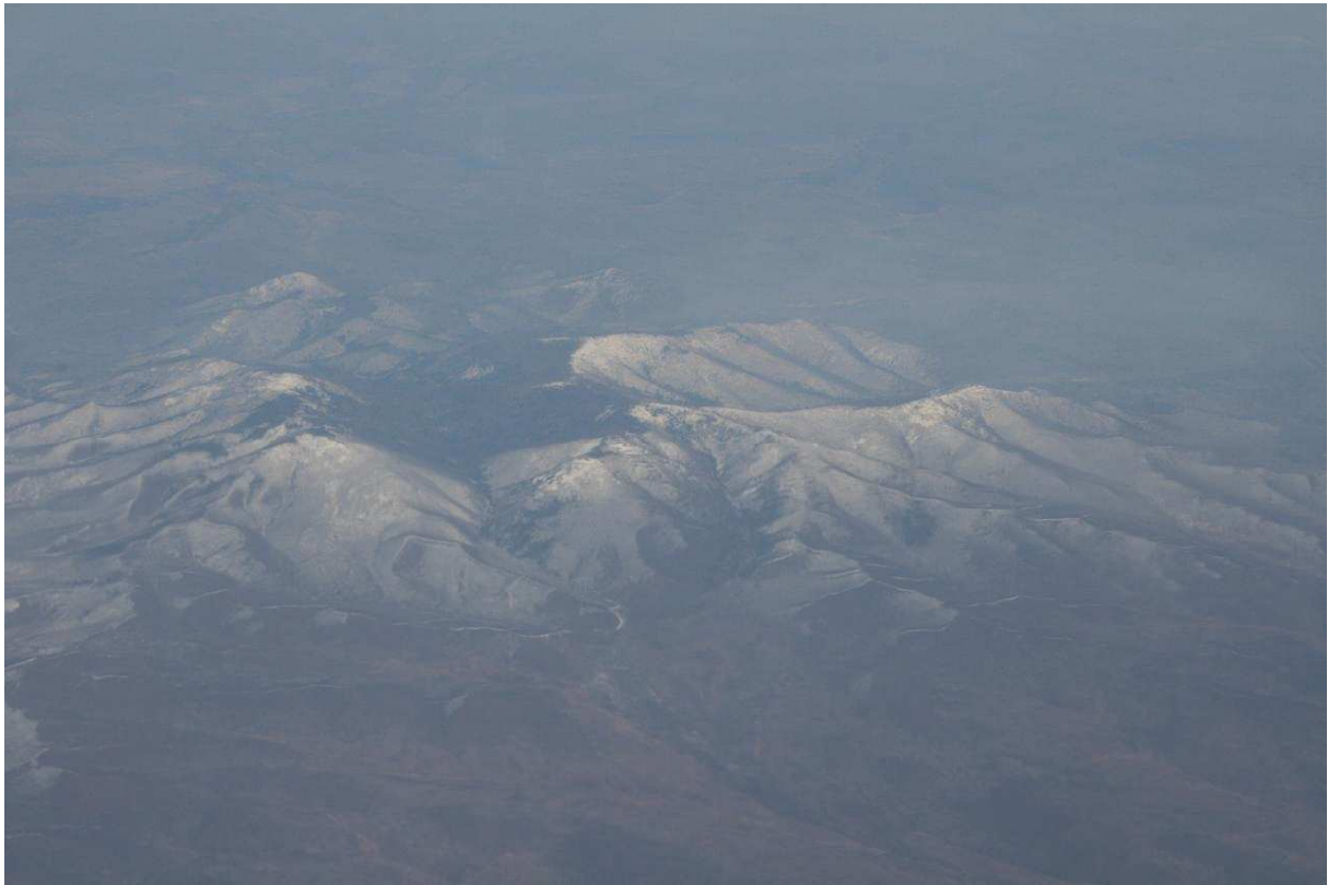
Besneeuwde bergen tijdens de vlucht van Vladivostok naar Moskou

Tevens ben ik vandaag 7 uur terug gegaan in de tijd. Wel een mooie vlucht gehad met helder weer. Dus het besneeuwde Siberië en de Oeral vielen heel mooi te zien vanaf die hoogte.