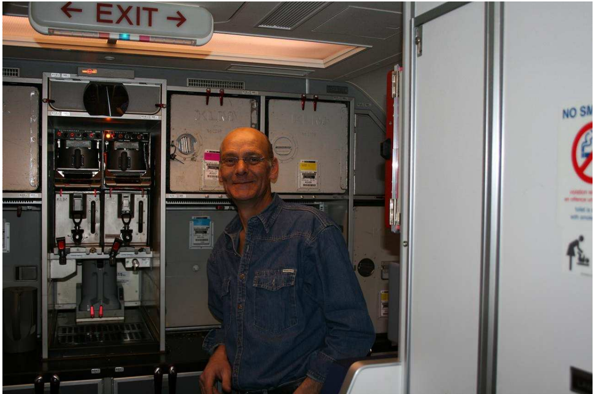
Achterin het toestel, gemaakt door een van de stewardessen waar ik een praatje mee maakte

We zullen op Schiphol via de “Kaagbaan” landen. Er hangen een paar wolken, dus bij het dalen zitten er een paar “hobbels in het wegdek”.