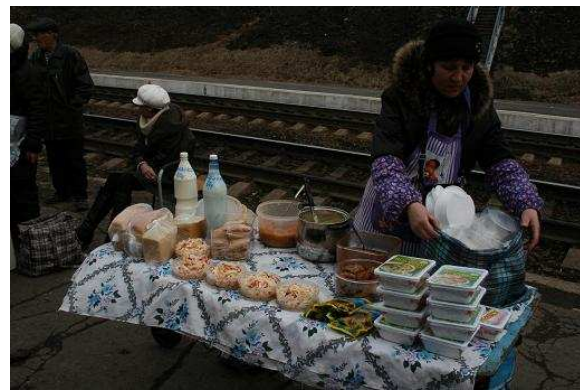
Allerlei eten word op het perron verkocht

Soep, salades, vis, vlees, kip en nog veel meer. Wat is dit leuk en gezellig om te zien! En natuurlijk ontbreekt de vodka en het bier niet.