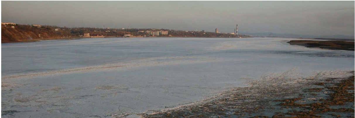
Amur rivier met op de achtergrond Chabarovsk

Uit de luidsprekers van de wagon klinkt weer heel zachtjes gezellige muziek. In de restauratie drink ik CTO gram vodka en schrijf m'n dagboek. Het landschap is nu geheel vlak. We rijden al een tijd langs een autoweg, maar geen auto te zien. Zo nu en dan passeren we een stationnetje midden in het onbewoonde gebied. Vlak voordat we in Chabarovsk arriveren, komen we over de brede "Amur" rivier.