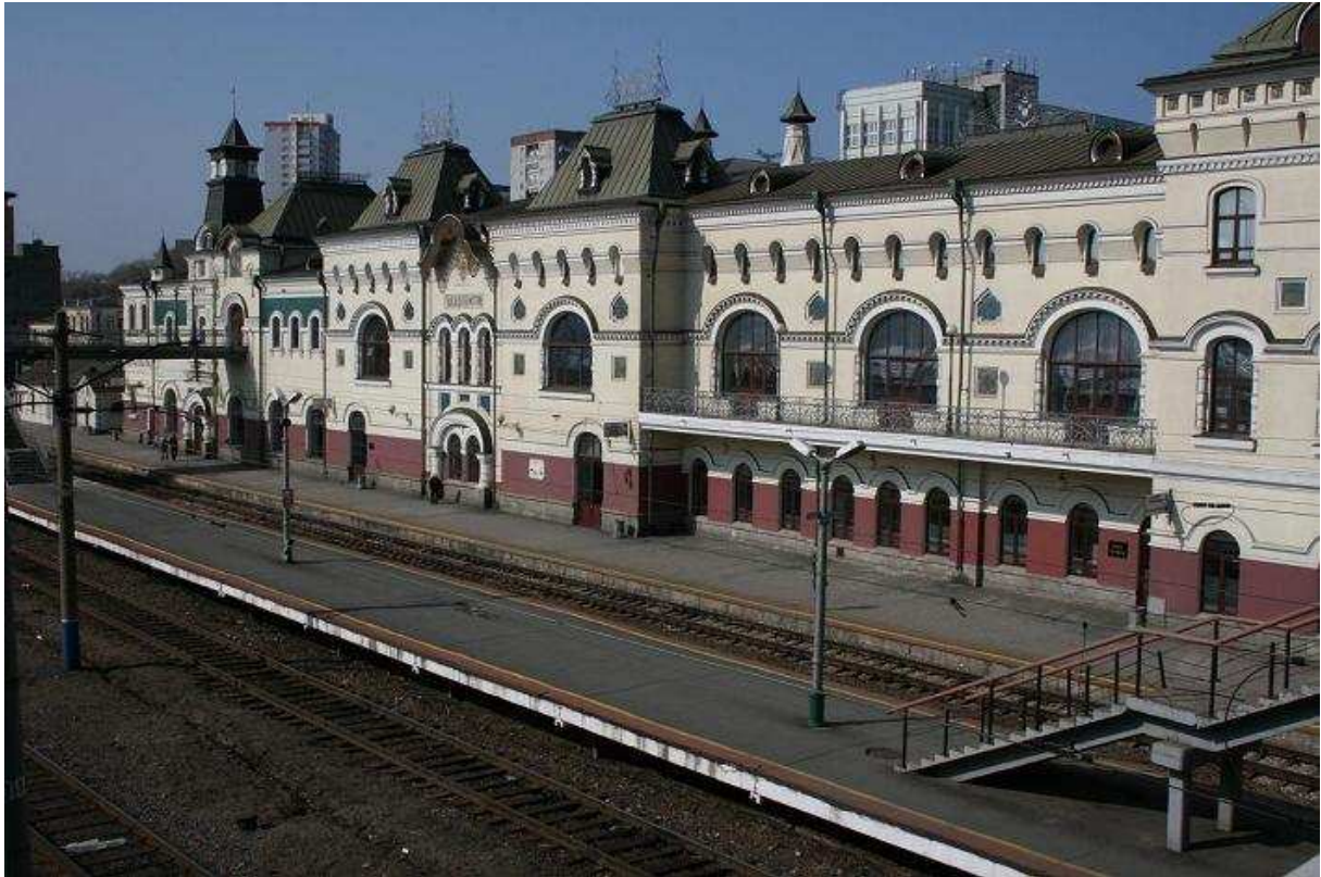
Treinstation Vladivostok, eindpunt van 9.288 km spoorrails...

Tijdens het eten zag ik op zee een ijsplateau dat aan kwam drijven. Op de 9 de etage heb ik hiervan nog een paar foto's gemaakt. Nog 2 nachten en 1 dag, dan vlieg ik terug. Het avontuur loopt op z'n eind... Maar ik heb tot nu toe genoten, en geniet nog steeds van alles wat er gebeurt. Dit is echt geweldig!